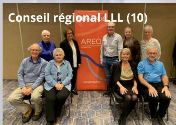
Conseil régional LLL (10)